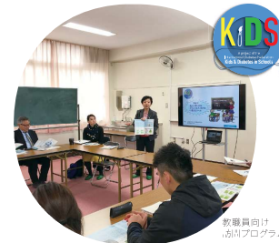
教職員向け 講座プログラム

1型糖尿病の子どもをサポートし、学校に通う子どもたちに健康的なライフスタイルを啓発するため、国際糖尿病連合 (IDF) と国際小児思春期糖尿病学会 (ISPAD)、サノフィ・グループは、2013年に「KIDS Project」を立ち上げました。日本では、公益社団法人日本糖尿病協会と協賛し、1型糖尿病患者の学校環境のサポートに加え、青年期における2型糖尿病の予防を目的に活動しています。